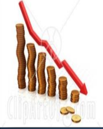
פער גדל בין עשירים לעניים