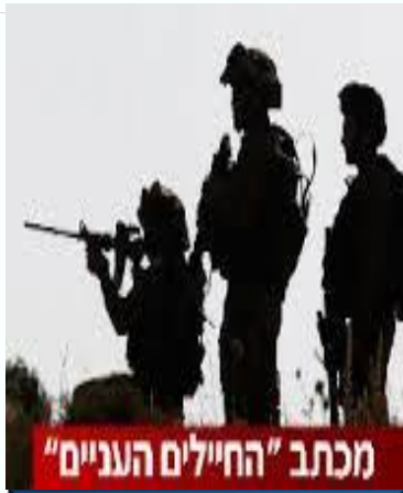
עליית יוקר המחיה